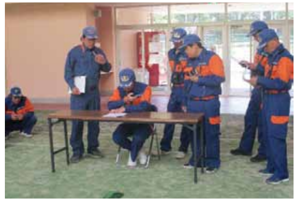
無線交信訓練の様子