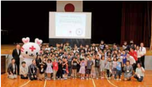
写真は本文と関係ありません

みんなから教えてもらったことで、わたしも、友だちや下の学年の友だちにもやさしくしたいなと思いました。みんなからもらったパワーを、わたしもやさしさでおかえしできたらいいなと思います。