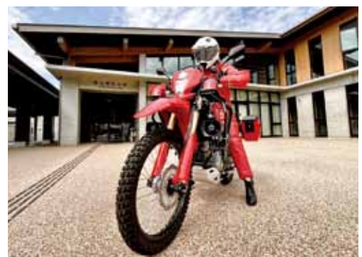
赤バイに乗車する隊員

車が進めない悪路や狭い道でも迅速に移動できる機動性を活かし、発災時の情報収集や初期消火、救急救命活動に活躍します。地域の防災力を高める新戦力として、安全・安心な町づくりに役立ててまいります。