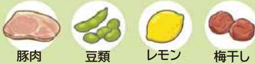
豚肉 豆類 レモン 梅干し

A 『量』より『質』! ビタミンB 1 とクエン酸を。 普段の食事に、豚肉や豆類(ビタミンB 1 )、レモンや梅干し(クエン酸)をプラスするよう心掛けましょう。