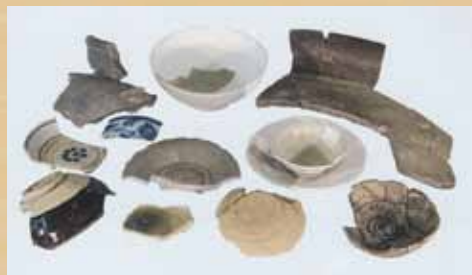
河後森城の様々な出土品

このように、遺物の分析は、小さな断片から過去のネットワークや文化、そして戦乱の記憶を再構築する作業と言えます。足元に眠る遺物をひも解くことは、私たちの故郷が歩んできた数百年におよぶ道のりを知ることには他なりません。 (続く)