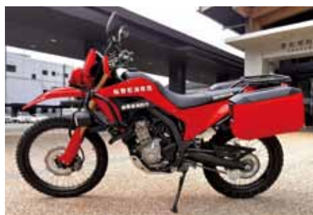
貸与を受けた赤バイ車両