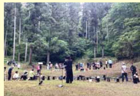
河後森城コンサート