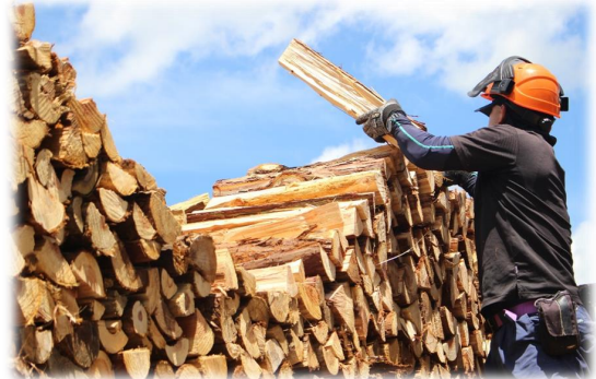
薪乾燥（薪積み作業）