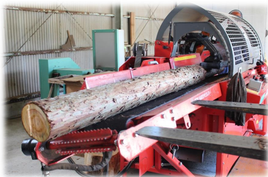
薪加工（大型薪割り機）