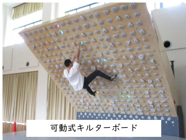
可動式キルターボード

日本国内でも数少ない可動式キルターボードを管理運営しながら、自然豊かなフィールドを活用したアウトドアアクティビティ推進活動（クライミング、マウンテンバイク、キャニオニングなど）を行い、松野町のアウトドア聖地化を目指す活動を行います。ボルダリングを主軸としたアクティビティが得意な方を募集します。