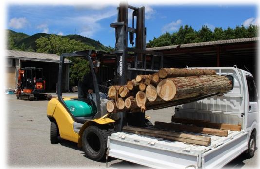
森の国まきステーション受入れ