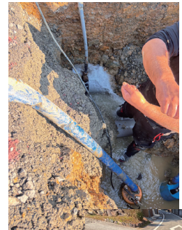
現在も漏水が発生しています。 ※現在の漏水修繕の様子