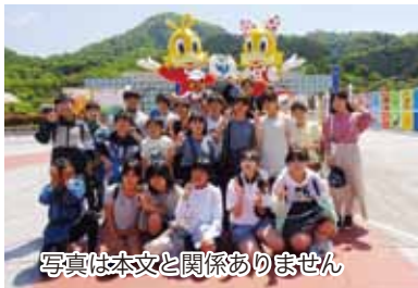
写真は本文と関係ありません

何が正しいか、何が正しくないのかは人によって違います。結局、何が大切なのかというと、相手のことを理解しようとする気持ちだと思います。私はこれからいろいろなものを見聞したり、体験したりして、固定概念にとらわれず、自分の視野を広げていきたいと思います。