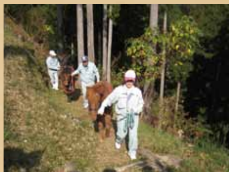
野間馬の登城実験の様子(平成21年)

過去に河後森城では、以上のような絵巻物を参考に馬屋の内装を整備し、実際に日本在来の馬である野間馬の登城実験を行っています。競走馬のサラブレッドなどと比べて小柄ではありましたが、どんどんと勇猛果敢に山道を登る姿は、中世当時の様子を彷彿とさせるものでした。(続く)