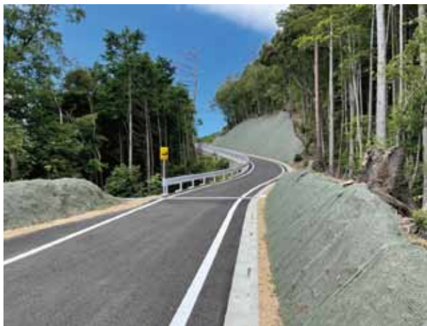
林道延野々遊鶴羽線

林道延野々遊鶴羽線は、独立行政法人緑資源機構が平成6年度に着工し、平成21年度から愛媛県が工事を継承して施工しました。令和6年7月に延野々古井谷から奥野川上組までの間が全線開通しました。