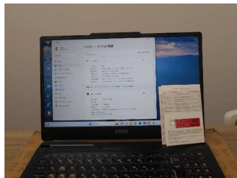
（システム用パソコン）