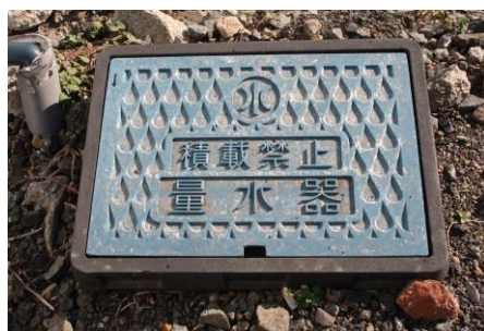
メーターボックス(量水器)