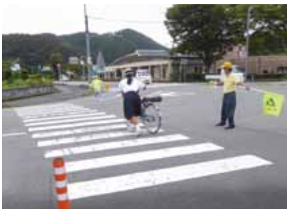
【中学校 登下校の見守り活動】