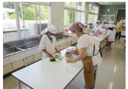
【西小学校 調理実習の補助】