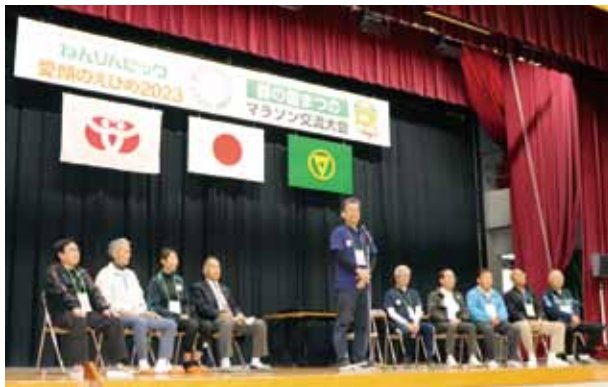
開始式 大会長(町長)あいさつ

沿道での応援や交通規制など、町民の皆さまにもご支援ご協力をいただき、誠にありがとうございました。