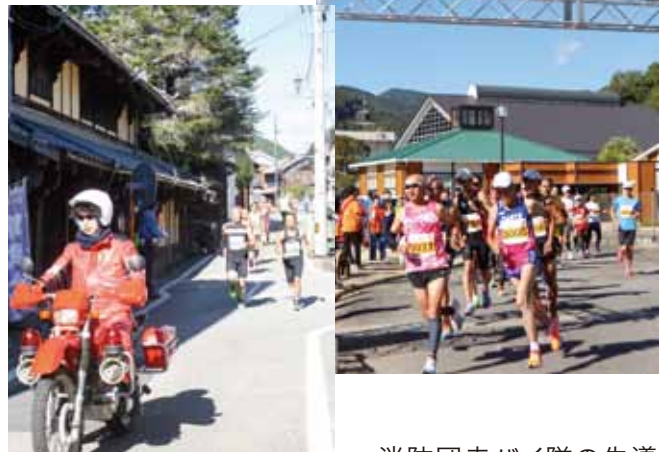
消防団赤バイ隊の先導