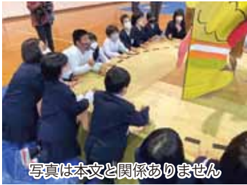
写真は本文と関係ありません

正しい知識を持つて、相手のことを考え、相手がいやがることはしないように、しっかりと考えて生活していきたいです。