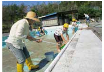
【東小学校 プール清掃の手伝い】