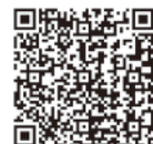
インボイス制度特設サイト

※ 国税庁インボイス制度特設サイトでは、インボイス制度について解説した(国税庁動画チャンネル)のほか、Q&Aなどを掲載しています。