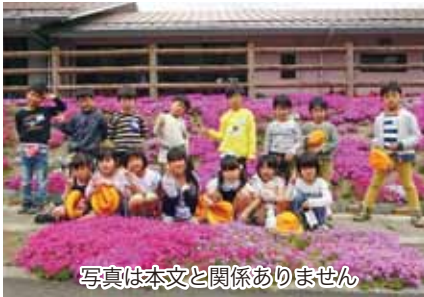
写真は本文と関係ありません

世界にはまだまだたくさんさんの差別が残っている。おそろくぼくが大人になるころにも差別は完全になくならないかもしれない。多くの国の人々にぼくの言葉で語りかけ、分かり合いたい。それはかん単なことではないのかもしれないが、きつとできる。差別をしてしまし、弱い心はきつとだれしも持っている。しかも、一人一人が弱虫な心に打ちかち、少しづつ勇気を出せば、きつと今より差別のない明るい未来になるはずだ。