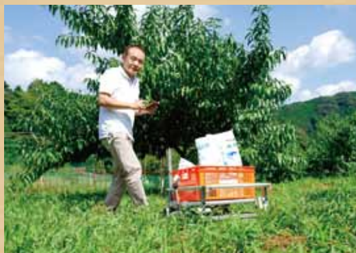
未来の愛大生へ（六車）

開発中の農作業ロボットで主要制御電子部品となっているマイコンをメイン教材に使用、地域課題解決に密着したIT教材で電子工作・プログラミング教室を開催、サツマイモの6次産業化プロジェクトに協力してサツマイモ収穫コンテナを搬送するロボットを試験走行。