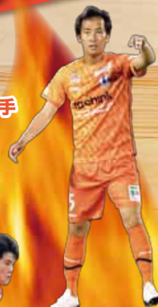
#5 前野 貴徳 選手

なおオンラインチケットは今シーズンより全ての座席がお求めやすくなっております！ 全席種が一律1,100円引きとなるクーポンを発行しております。 クーポンの申込受付期間は～10月6日（金）正午までです。 チケット入手方法の詳細については下記URL（QRコード）をご参照ください。 https://ehimefc.com/ticket/mcmtticket.html