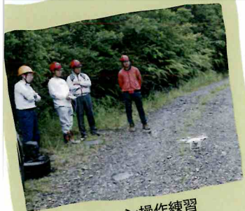
ドローン操作練習