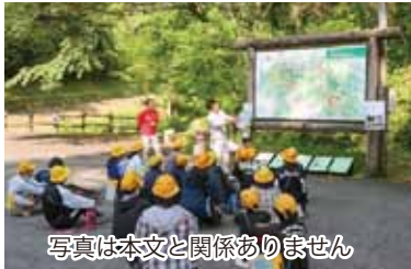
写真は本文と関係ありません

私は、あおぞら子ども会に参加して、人権について学習をしています。私が学習した中で、心に残っていることを紹介します。 まず、あおぞら子ども会の先ばいである高校生から聞いた話です。その先ばいは、「聞く」ことが大切だという話をしてくださりました。「聞く」ことで様々なことを知ることができるといふ話の内容でした。 私は、その話を聞いて、知ることについて二つ考えました。一つは、相手の知ることができるといふことです。「聞く」ことで、その人の考えを知ることが出来ます。そして、お互いを理解し合うことができますと思えました。もう一つは、知識として知ることです。知ることでおかしいと思うことに気付くことができます。まずは、様々なことを正しく知ることが大切だと思えました。 次に、ほかくした野生動物の肉を加工する仕事をしている方に会って話を聞いたことです。偏見について学習しました。世の中には、見た目だけでなく仕事の内容で偏見を持つ人がいるそうです。少しおどるきましました。私たちが、生きていくために必要な仕事をしてもらっているのにその仕事に、偏見を持つなんておかしいと思えました。その方は、「最初は肉を加工する仕事にいいところがあったけれど、だれかがやらな」と話してくださいました。 私は、毎日だれかがどこかで私たちのために仕事をしてくださっていることを知りました。そして、そのおかげで、生活することができていることに感謝したいと思えました。 また、私たちが生かしてくれているのは、人だけではありません。食事に使われている動物も同じです。生きるためには、食べなくてははいけません。そうした生き物にも感謝をして、「いただきます。」「ごちそうさま。」と言いたいです。この学習から、命の尊さについて考えました。 私は、あおぞら子ども会で、いろいろなことを知ることができてよかったです。大人になっても人を見た目や職業で判断しない人になります。