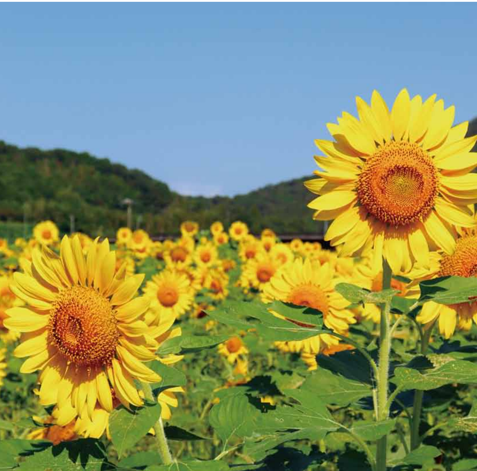
吉野生駅周辺 ひまわりの群生（令和5年9月27日撮影）