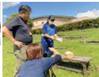
▲定例区長会の見学