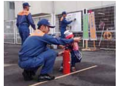
▲令和元年度開催時の様子