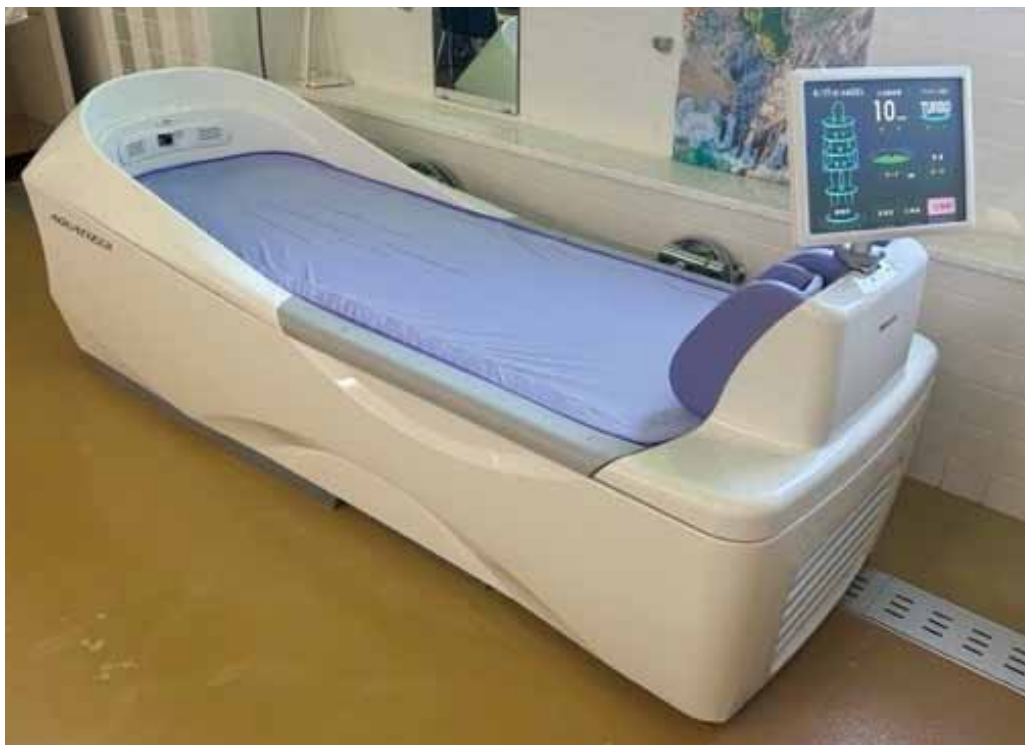
ベッド型マッサージ器アクアタイザー-Q Z-260