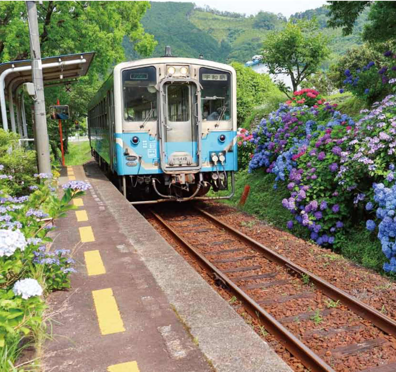
予土線と紫陽花（真土駅）