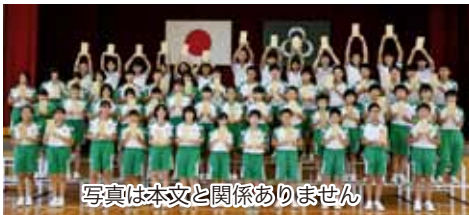
写真は本文と関係ありません

現に、私たちの学校では、一生懸命に考える機会を増やして、人権学習をしています。まず私たちが、「差別をしない」「みんなのことを思いやる心」を、私たちの住む町へ、そして県内に広げていくべきです。私は、これからも人権を学び続けていきます。