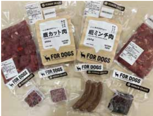
FOR DOGS 商品

販売は、まつのジビエと同じく直売所において、特設コーナーを設け2月23日(木)から開始しています。この機会に、『FOR DOGS』を含めた『まつのジビエ』ブランドを是非お試しください。