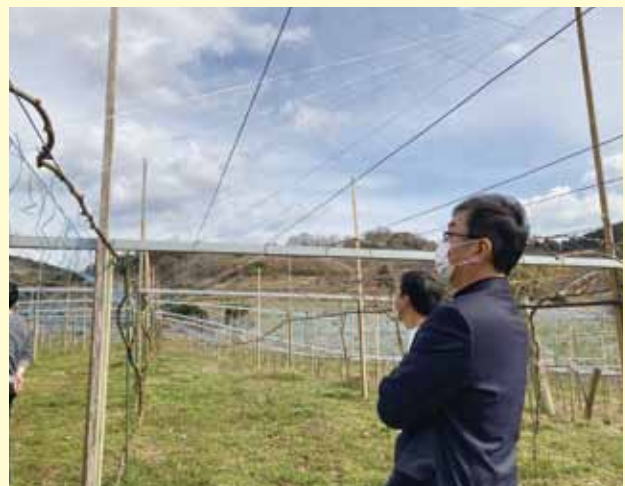
大規模園地を視察