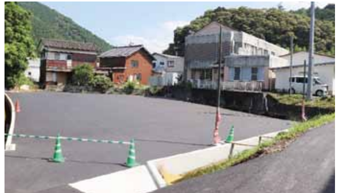
公用車・職員駐車場整備状況（商工会裏）