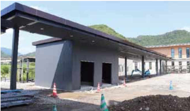
新庁舎とコミュニティセンターを結ぶ付属棟（渡り廊下）