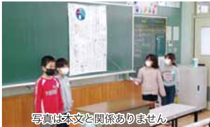
写真は本文と関係ありません

これからも、「ごめんね」と言ったらほっとすることをわすれずに、けんかをしたらあやまるようにしたいと思います。そして、こうして分かったことを友達みんなに伝え、いやな思いをさせてしまったらすぐにあやまることのできる三年生になりたいです。