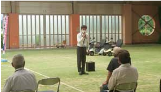
《販売事業者による講義》

シニアカーの扱い方や交通ルール、道路での危険性などについて講義を受けた後、段差のあるコースを使った実技講習が行われました。初めてシニアカーに乗ったという方もいましたが、講師の案内を受けて無事にコースを回りきりました。