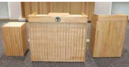
花台 演台 司会者台

「封かん機」を寄付いただき、庁舎1階印刷・作業室に設置させていただきました。発送作業の効率化が図られました。