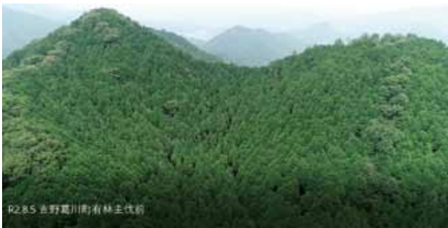
伐採前（令和2年8月現在）