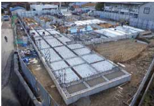
③床下断熱材敷設工事