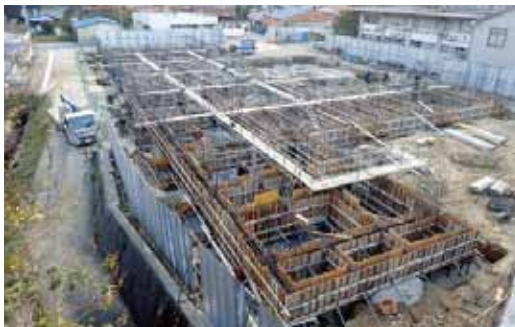
①基礎鉄筋・型枠工事

基礎部分の鉄筋工事、型枠工事、コンクリート工事、床下断熱材敷設工事が完了しました。