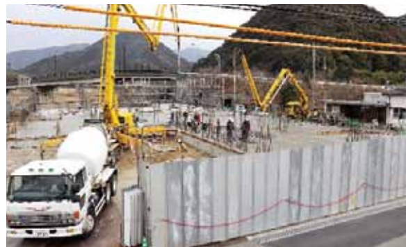
④土間・床コンクリート打設工事