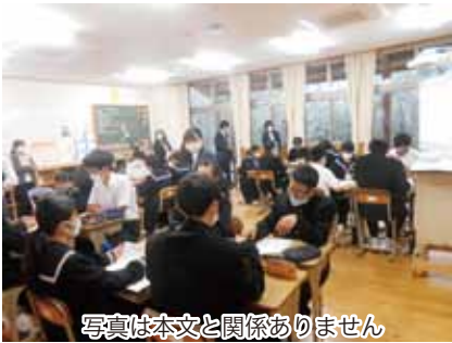
写真は本文と関係ありません

人権問題。未来を託されている私たちが声を上げるなら、何かが変わると思う。そのため、この問題について学習し続け、自分から行動をしていきたい。差別のない世の中にする、そう願う気持ちはいつの時代も変わらない。私はそう考え、学んだことを生活の中で実践していくと決意した。