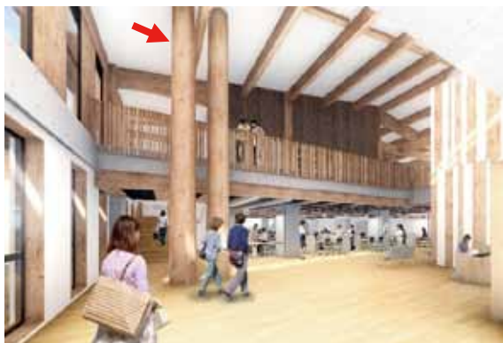
図①：シンボル柱（磨き丸太）設置イメージ

なお、柱材には、愛媛森林管理署からご提供いただいた滑床山国有林（滑床キャンプ場内）の樹齢120年生のヒノキを使用しています。