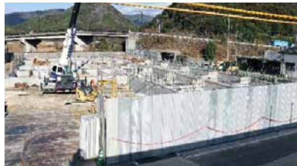
②基礎コンクリート工事