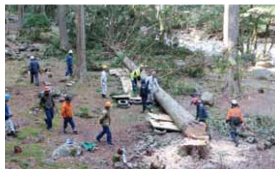
伐採作業状況（滑床キャンプ場内）