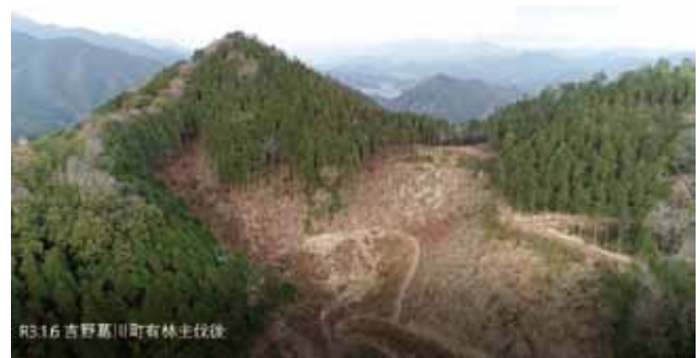
伐採後（令和3年1月現在）