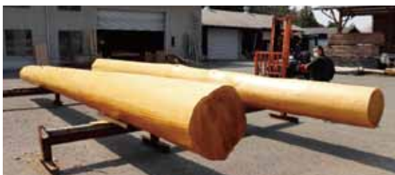
磨き丸太加工状況