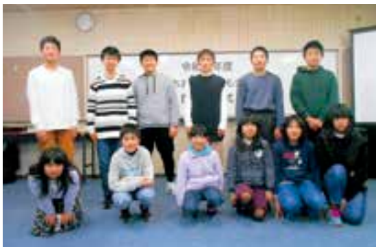
令和元年度の活動

令和2年度も「あおぞら子ども会」を開催する予定です。多くの皆さんの参加をお待ちしています。