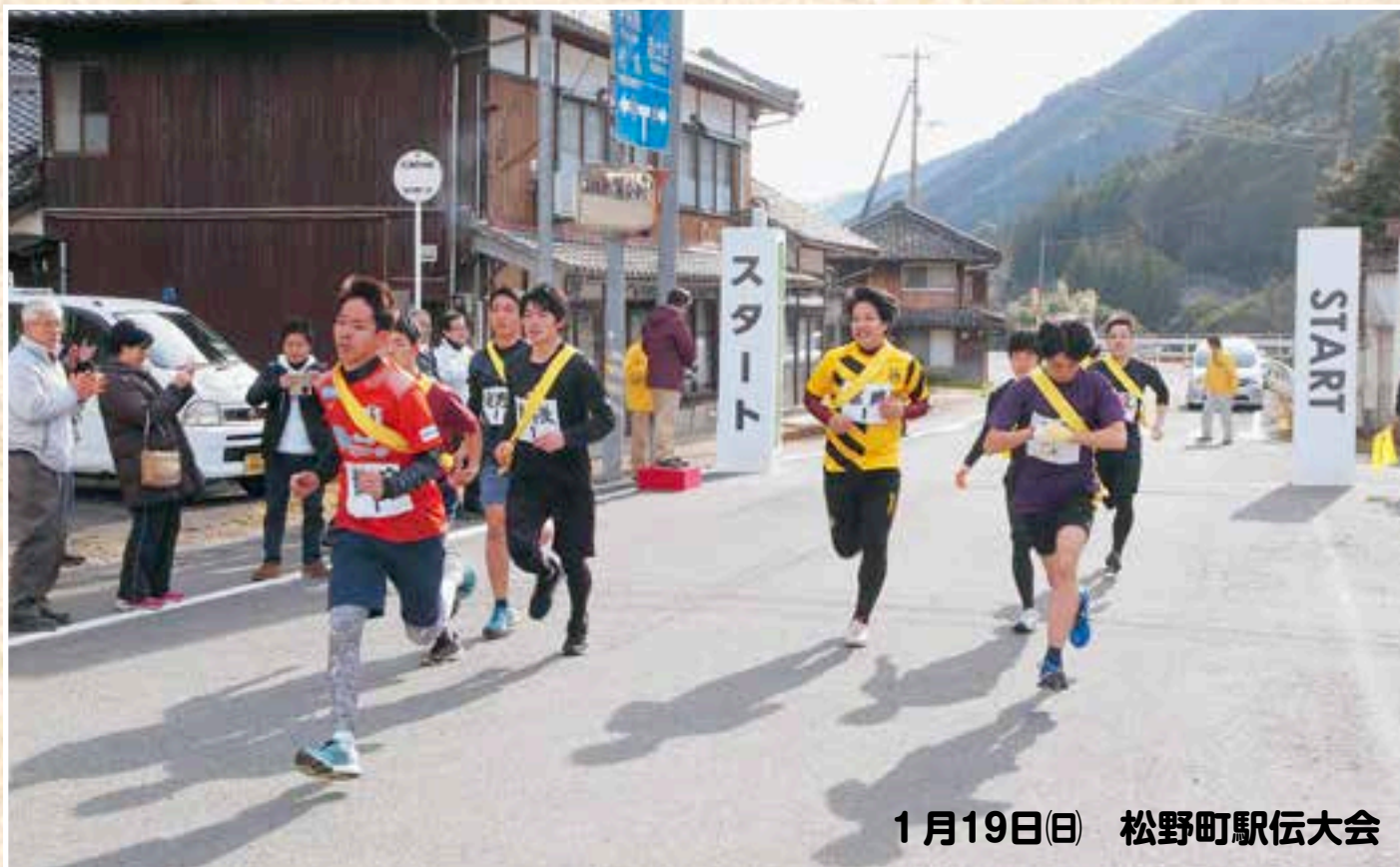
1月19日(日) 松野町駅伝大会