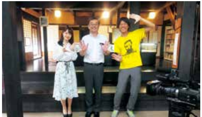
▲撮影の様子(不器男記念館)