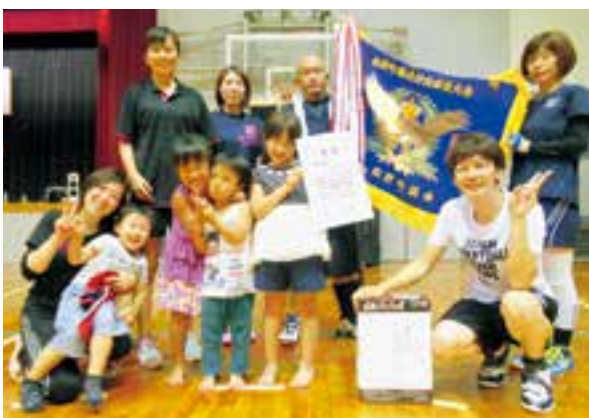
▲優勝したフレンドB(ブラボー)チームの皆さん

決勝戦は、「フレンドB(ブラボー)」チーム対「ライフA定食」の対戦で、「フレンドB(ブラボー)」チームが見事優勝しました。