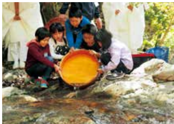
▲アマゴの稚魚放流の様子