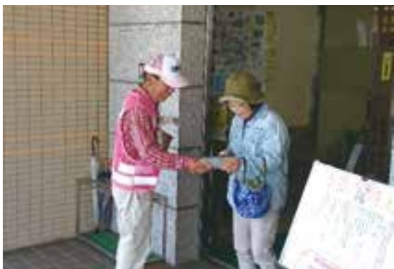
▲チラシ配布の様子

また、期間中には、町内各所で新入学・新学年を迎えた子どもたちを対象とした「街頭指導」が行われ、交通安全協会の町内各支部役員、交通指導員をはじめPTA・学校関係者など、地域の皆さんの協力により、子どもたちの安全な通学と通勤者等への交通安全の啓発が図られました。