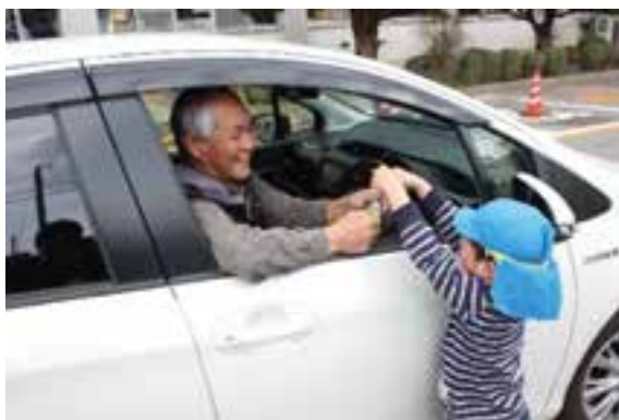
▲マスコット配布の様子