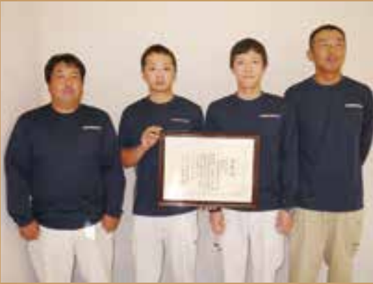
松野町農林公社職員の方

今後も農地所有適格法人とし、松野町の農業の牽引役として、大きな役割を担っていく事が期待されています。