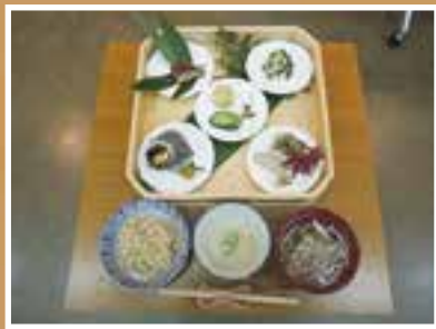
復元した戦国御膳 (鴨の塩焼きや冷汁など)