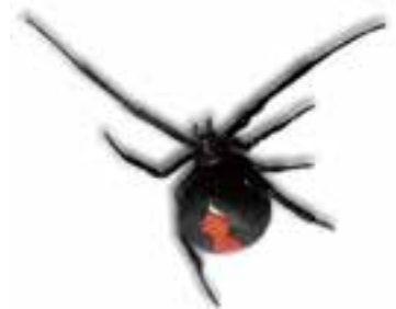
セアカゴケグモ 体長：約0.7～1cm