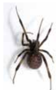
ハイイロゴケグモ 体長：約0.7～1cm