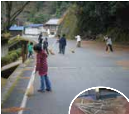
松野南小学校での清掃の様子