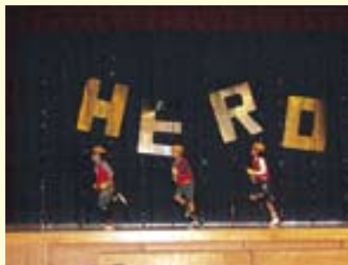
1・2年 ダンス 僕らのヒーロー