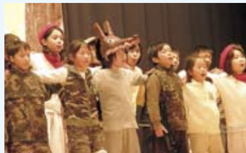
4年 劇 きばのない狼