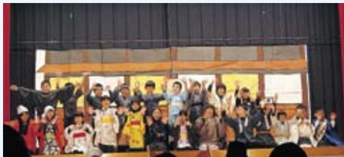
3年 劇 寿限無(じゅげむ)