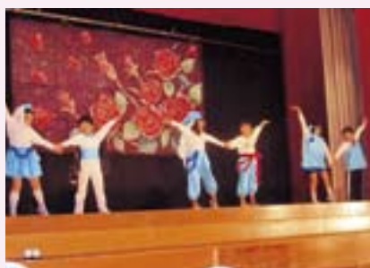
1年生 ダンス：コングラチュレーション