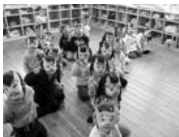
節分のお話を聞く園児