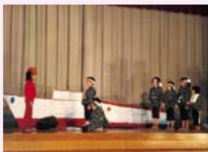
2年生 劇 島ひきおに