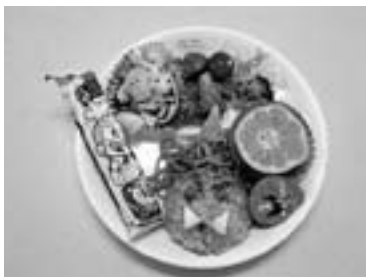
鬼もうれしい 節分メニュー