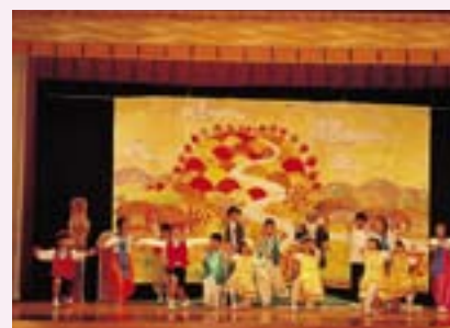
3・4年生 劇 三年とうげ