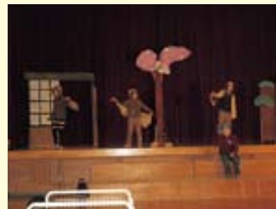
3・4年生 劇 目黒の里の聞き耳ずきん