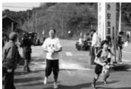
懸命にたすきをつなぐ選手