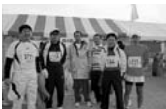
愛媛マラソンに参加した町内のランナー

会場には、各市町村から応援ブースが来店し松野町産業振興課では、温かいお茶のサービスや特産品販売などで町のPRに努めました。