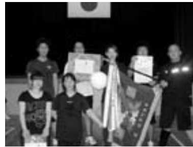
優勝したライフまつのAチーム