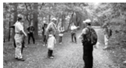
アウトドアインストラクター育成講座