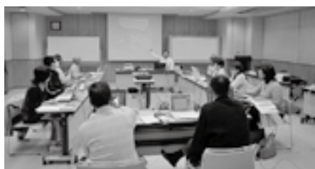
ネットビジネス講座