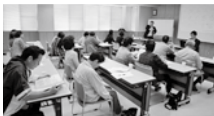
ジビエ食品衛生講座