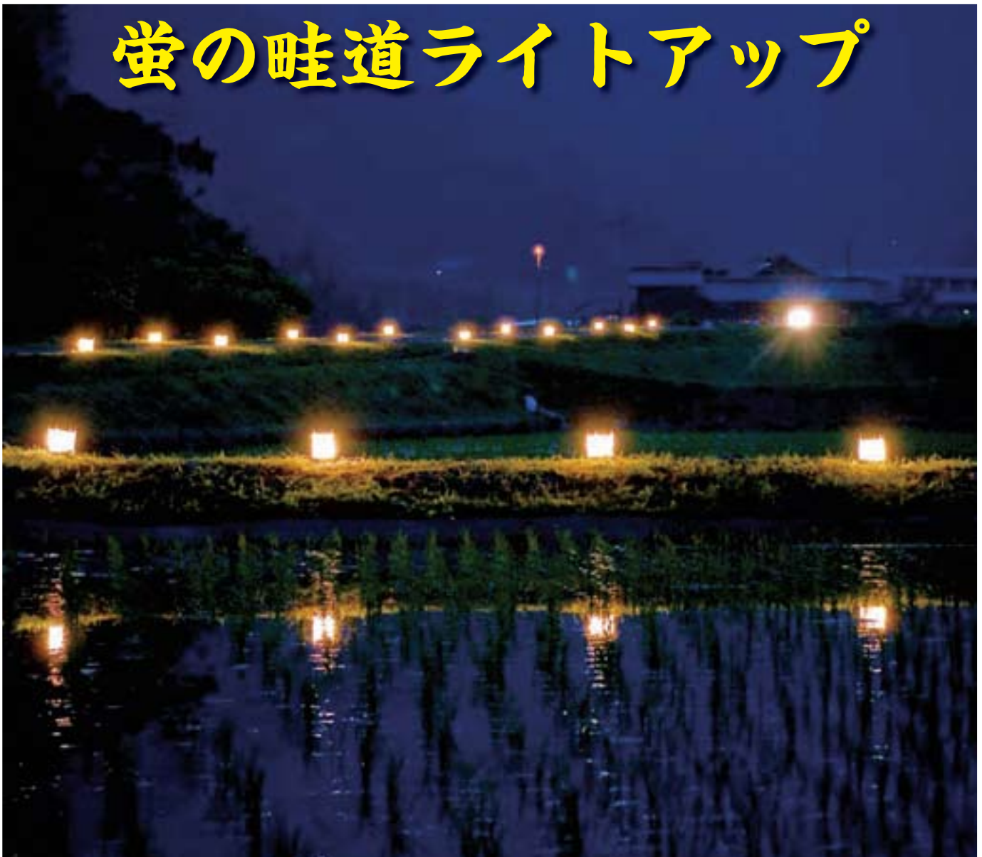
6月5日(土)松野南小学校とその周辺で、蛍祭りが行なわれました。3ページに関連記事