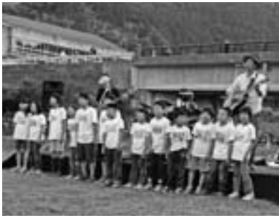
サウンドオブ休耕田

また、地元有志によるふるさとバザーや大学生の畦道カフェも設置され、目黒米のおにぎり、草もち、炭酸まんじゅうなど手づくりの味が人気をよんでいました。