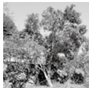
昭和合併記念のユズ