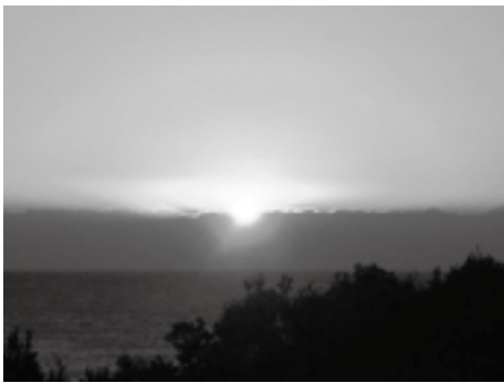
美しい太平洋の日の出

寒い季節は、運動をする機会が減りますが、寒さに負けず元気にウォーキングを楽しんでみませんか。 運動は、体力の向上、体調の維持、気分転換など心身の健康増進に役立ちます。 真冬の夜のちよつとハードで楽しい企画「ウォーキングアドベンチャー」を1月15日(金)の夜から16日(土)の朝にかけて行います。