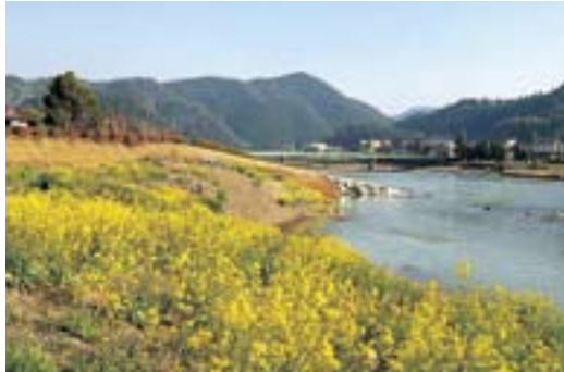
虹の森公園菜の花