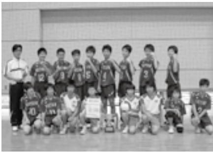
優勝した男子バレーボール部

勝ち抜いた選手達は、7月19日から松山市で開催される県中学校総合体育大会に出場することになっています。県大会での活躍が期待されます。