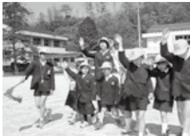
東小交通安全教室

運動期間の6日(月)には、虹の森公園駐車場で出発式が行われました。鬼北交番や交通安全推進協議会から約40人が参加し、交通安全宣言を行い自動車パレードと人の輪作戦を実施しました。