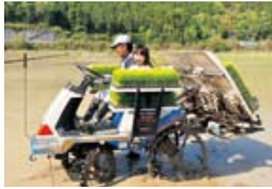
おじちゃん楽しい田植え

◇世帯数 1,950世帯(+5世帯) ◇総人口 4,579人 (+1人) 男2,178人 女2,401人 (4月中の異動) 出生 0人 死亡 8人 転入 31人 転出 22人 平成21年4月30日現在