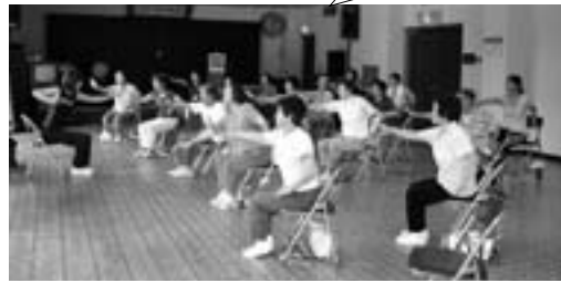
平成20年度おたっしや教室 (目黒地区)

ちしています。 ※目黒地区をスタートに吉野地区・保健センターの三会場で開催します。目黒基幹集落センターでの日程は左記のとおりです。他の二会場についてもその都度お知らせいたします。