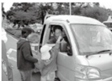
保育園児マスコット配布

15日には保育園児のマスコット配布が行われ道行くドライバーに園児も交通安全を呼びかけました。