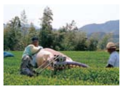
茶摘み作業 (吉野地区)