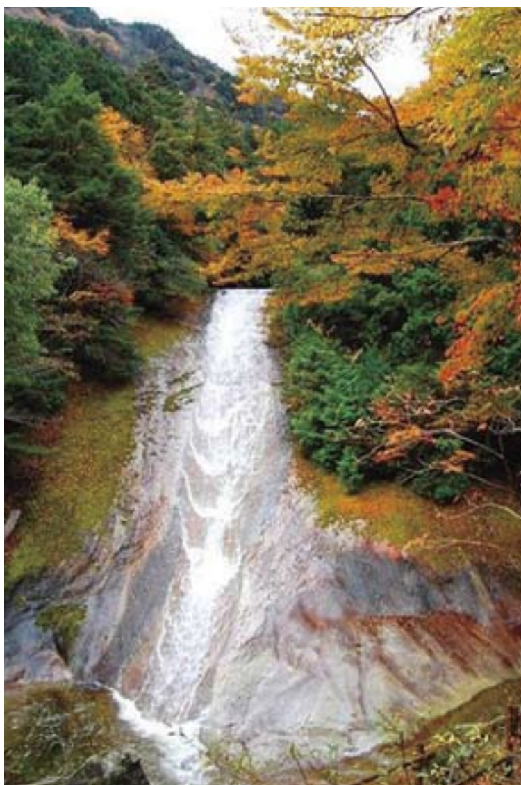
(水量豊かな雪輪の滝)