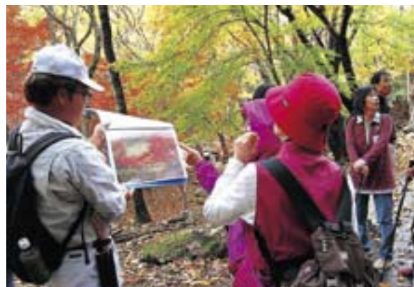
(参加者に説明するネイチャーガイド)

11月11日(水)紅葉真っ盛りの滑床でネイチャーガイドと歩くモニターツアーが実施されました。 町内外から18人のモニターが参加し、秋の滑床を堪能しました。