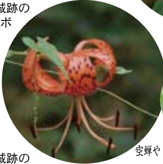
河後森城跡のオニユリ