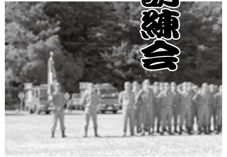
人員姿勢服装報告

れました。また、第3分団第3部による小型ポンプと第3分団第1部によるポンプ自動車操作模範演技も行われ炎天下での訓練会に花を添えました。岡町長より講評を受け、徒歩部隊・赤バイ隊・自動車部隊による分列行進を行った後、虹の森公園河川敷で一斉放水を実施して訓練会を終了しました。