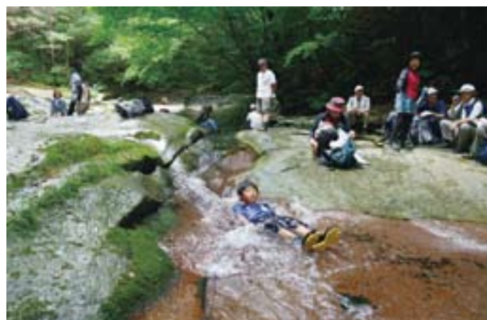
7月21日 滑床沢歩き 4ページに関連記事