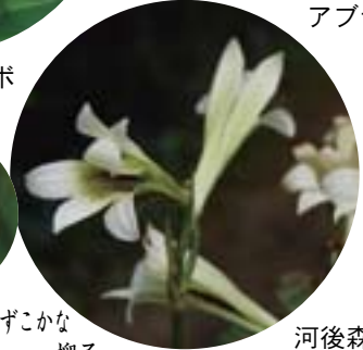
河後森城跡のシロユリ