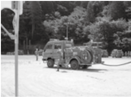
ポンプ自動車操作

この日は、午前7時30分の召集サイレンを合図に各団員が会場に集合し、8時30分から訓練会が開始されました。訓練会では、出初式以降の階級変更者と新入団員に団長が辞令を交付した後、各分団長、副団長の指揮で人員・姿勢・服装点検や自動車点検、機械器具点検が行われました。続いて、赤バイ隊の訓練と小型ポンプ、自動車ポンプ操作が行われ、日頃の訓練成果を披露した団員に拍手が送ら