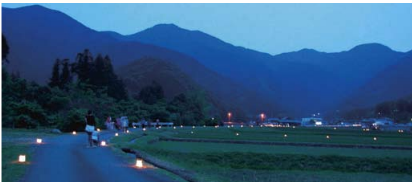
6月14日(土) 目黒地区で第3回蛍の畦道プロジェクトが開催