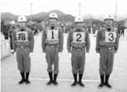
第3分団第3部の選手のみなさん