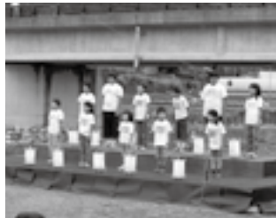
灯籠点灯セレモニーで熱唱する児童

この催しは、目黒の里ホテル愛好会が主催、目黒部落や四国風景づくりの会等の協力で南小学校周辺を会場に行われ町内外から大勢の人が参加しました。地元有志によるバザーや大学生の畦道カフェも設置され、目黒米のおにぎり、豚汁、アマゴの塩焼きなどふるさとの味が人気を呼んでいました。南小学校全校生徒12名がトンボやカニなどを描いてつくった灯籠も農