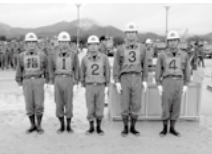
第3分団第1部の選手のみなさん

6月22日、第26回愛媛県消防操法地区大会が鬼北町の鬼北総合運動公園で開催されました。本町からは、小型ポンプの部に第3分団第3部「奥野川」が、ポンプ車の部に第3分団第1部「吉野」が出場しました。