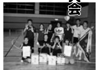
優勝・準優勝のさくらクリエイト

いよぎん(伊予銀行松丸支店) TEAM・EAST(松野東小学校) フレンドまつの ライフまつの スクールメイツ(西・南小職員)