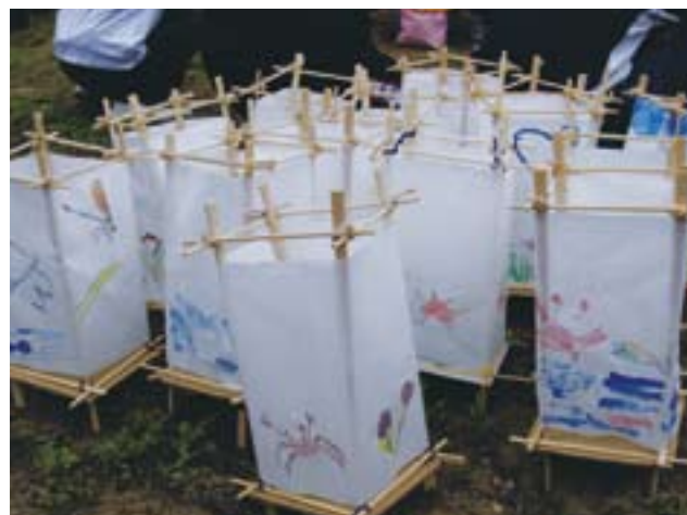
南小学校児童の作った灯籠