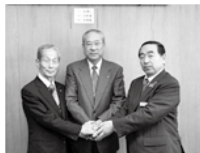
宇和島ケーブルテレビ株新津社長と両町長

また、施設等整備後の運営については、宇和島ケーブルテレビ株式会社を選定され、去る10月29日、鬼北町中央公民館において、2