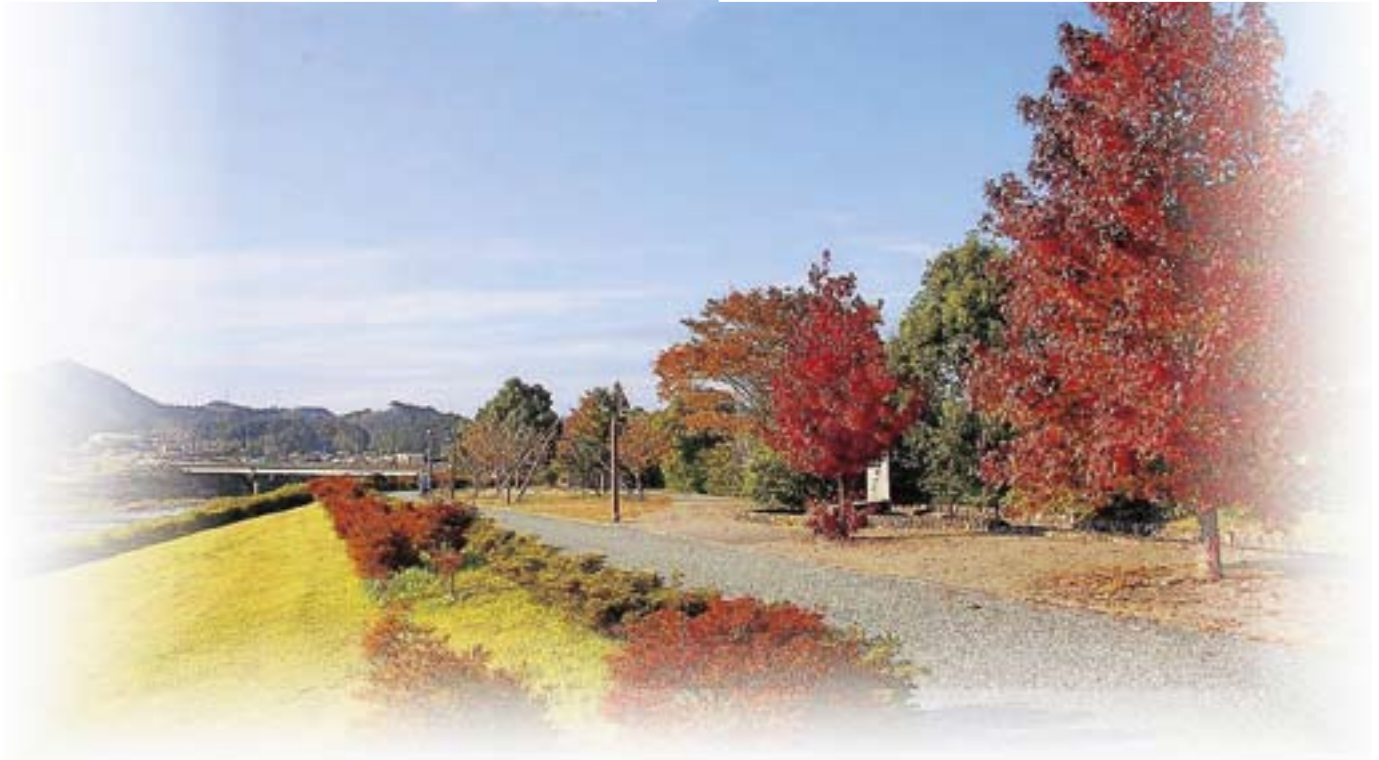
(上段) 河後森城山麓のもみじ・やすらぎ地藏さん (下段) 虹の森公園晩秋…写真 柳野治示氏